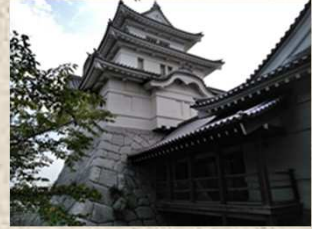
千葉県立関宿城博物館