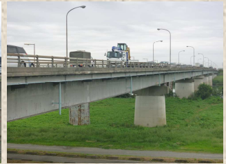
利根川に架かる境大橋