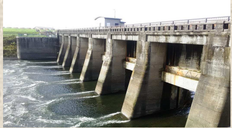
関宿水門（写真奥には関宿閘門がある）