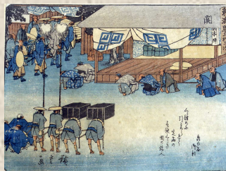
東海道五十三次 関 歌川広重画 松戸市立博物館所蔵