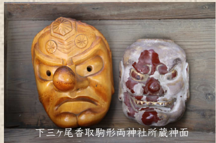
下ヶ尾香取駒形両神社所蔵神面