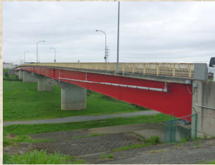
江戸川に架かる関宿橋