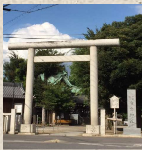
愛宕神社の大鳥居