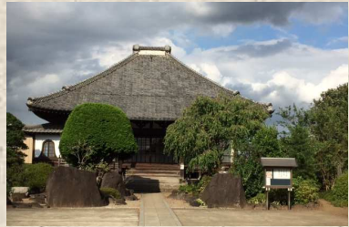
西念が創建した上花輪のあるお寺