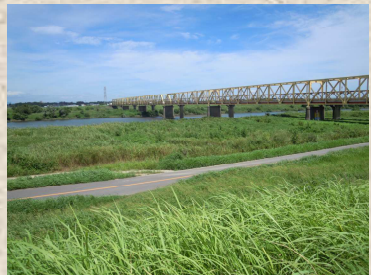
筵打あたりの風景（芽吹大橋）