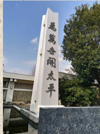
野田市鈴木貫太郎記念館